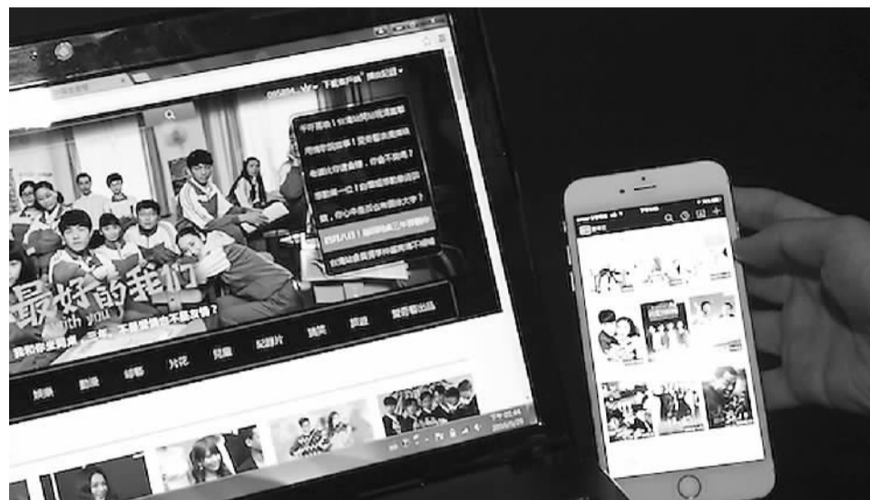
爱奇艺目前在台湾所支持的播放终端。(资料图片)

有台媒将2016视作为岛内OTT事业风起云涌之年。眼下美国最大的OTT提供商Netflix、日韩系的LINE TV、岛内某些影音平台都先后吹起号角。对于爱奇艺的加盟，岛内文娱业者乐见其成。