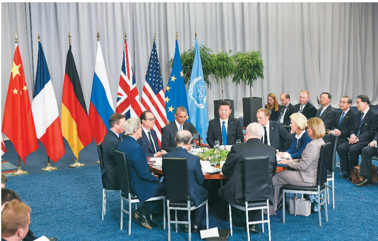
图为国家主席习近平在华盛顿出席伊朗核问题六国机制领导人会议并发表重要讲话。

资，积极探讨开展产能合作。今年是中拉文化交流年，双方要以此为契机，扩大文化、教育、科技、青年、体育等领域交流，提升旅游合作水平。中方支持阿根廷等拉美国家应对“寨卡”和登革热疫情的努力。双方要密切在重大国际问题上的沟通，加强多边协作。中方欢迎马克里总统于9月出席在中国杭州举办的二十国集团领导人峰会，希望阿方继续在中拉整体合作方面发挥积极作用。 马克里表示，阿中关系良好，同时发展潜力巨大。阿方感谢中方在基础设施建设、金融稳定、经济改革等方面给予的大力支持，欢迎中方企业加大对阿港口、铁路、公路、农业等领域投资，希望扩大两国基础设施、金融、旅游、体育、人文等领域交流合作，愿为中国公民赴阿提供更多签证便利。阿方愿加强同中方在国际事务中合作，支持中国成功主办二十国集团领导人杭州峰会。 王沪宁、栗战书、杨洁篪等参加会见。