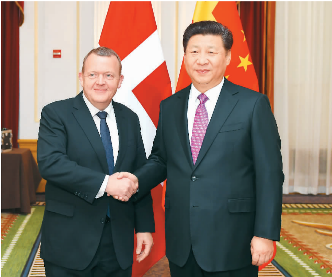
3月31日,国家主席习近平在华盛顿会见丹麦首相拉斯穆森。

本报华盛顿3月31日电 (记者杜尚泽、章念生、高石) 31日,国家主席习近平在华盛顿会见丹麦首相拉斯穆森。习近平指出,中丹关系发展凝聚了两国几代领导人的智慧和心血。近年来,中丹政治互信不断增强,务实合作全面推进。新形势下,中丹关系持续深入发展,符合两国和两国人民共同利益。习近平强调,目前,中丹关系正站在新的历史起点上。我们要加强政治引领和顶层设计,保持高层交往势头;对接发展战略,着力深化互联互通、绿色发展、低碳循环、医药食品等领域合作,打造更多旗舰合作示范项目;推进人文交流互鉴,密切人员往来,促进青年交流;加强在联合国等国际组织中的协调。希望双方携手努力,将2016年打造成为中丹全面战略伙伴关系的“进取年”,推动中丹关系