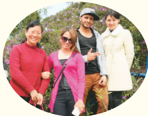
▲ 中外游客在广东省广州市花都区合影。