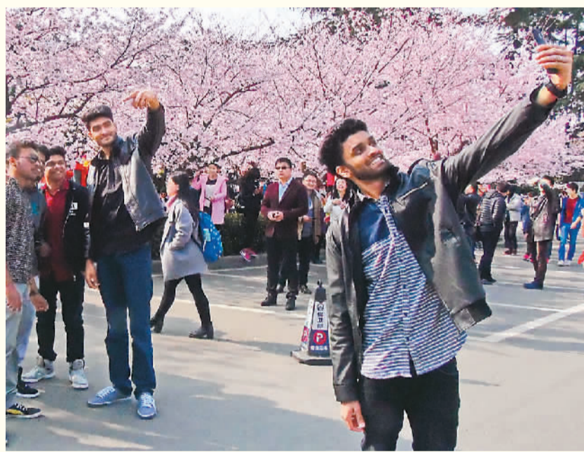
▲ 武汉大学里白色和粉红色樱花盛开争艳，吸引了众多国外留学生。

日前，由国家旅游局与河北省人民政府共同举办的“中美旅游年”高峰活动——“千名美国游客游长城”启动仪式，在承德金山岭长城脚下拉开帷幕，来自美国的1000名游客登上金山岭长城，饱览北国风光。