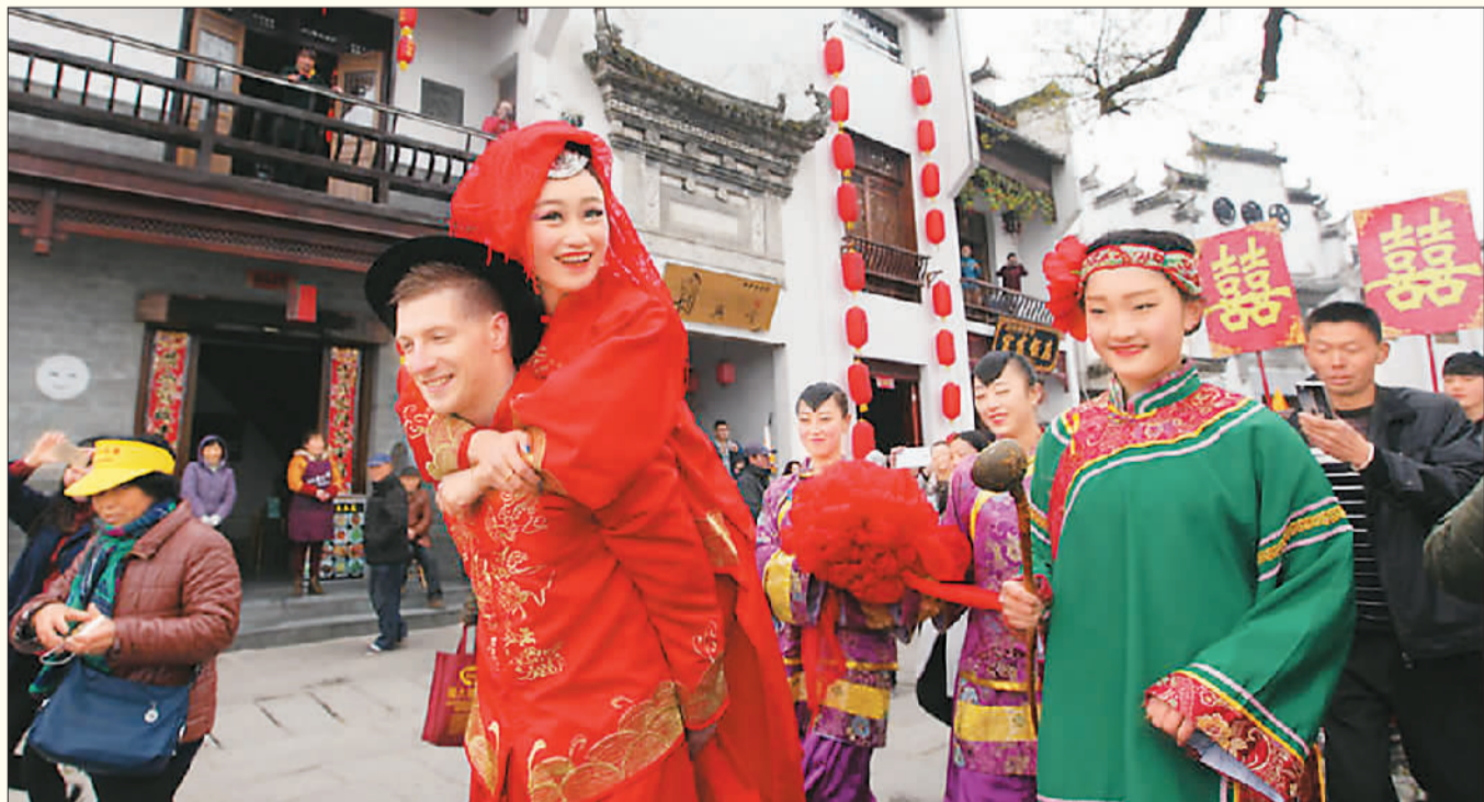
▲ 在安徽省黟县宏村，乌克兰新郎与徽州新娘上演了一场中式婚礼。