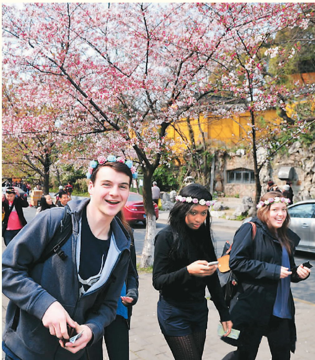
▲ 外国游客在江苏省南京市鸡鸣寺路观赏樱花。