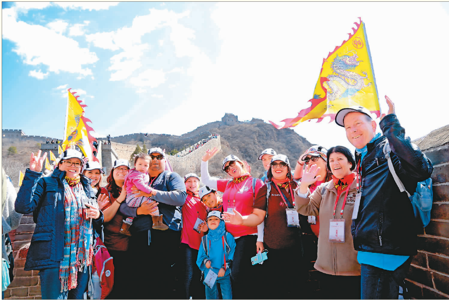
▲ 一组美国游客登上金山岭长城后合影留念。