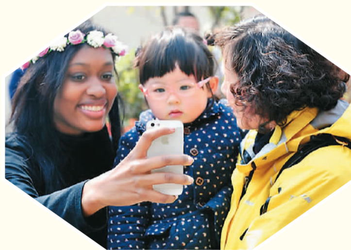
▲ 外国游客在江苏省南京市鸡鸣寺路和儿童合影。