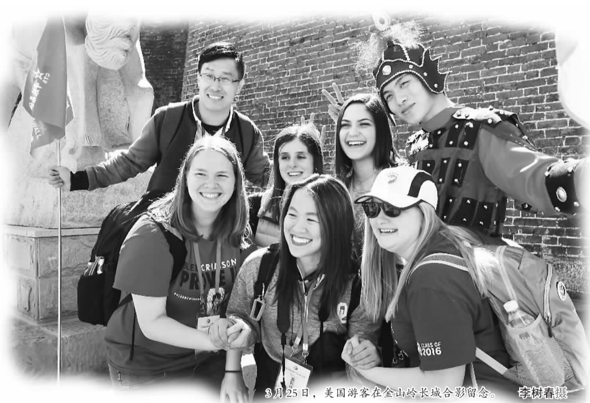
3月25日，美国游客在金山岭长城合影留念。

在海上丝绸之路沿线国家中，东南亚人口众多，是我国发展入境游的重点市场。记者从中国驻新加坡旅游办事处了解到，今年该处将在新加坡、马来西亚和印尼举办“美丽中国—长城联盟联合推广”活动，推广长城沿线省份旅游资源，提升长城联盟品牌在东南亚地区的知名度。为配合该活动，还将举办“我眼中的美丽中国”征文比赛和书画比赛。