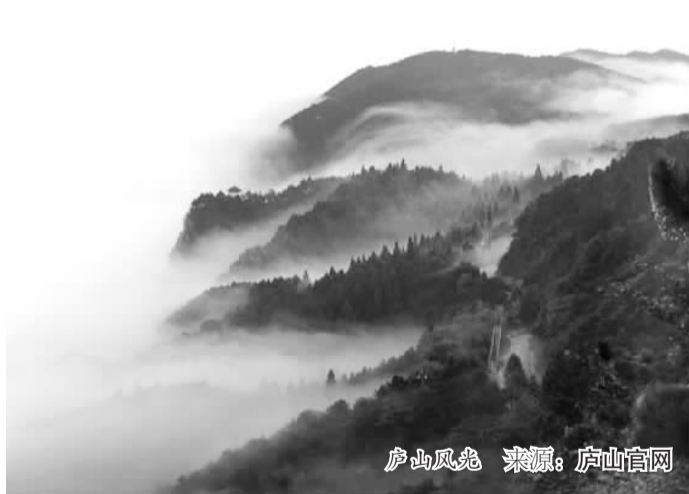
庐山风光

庐山雨量充沛，植被茂盛，到处是瀑布涌泉。当年，茶圣陆羽曾遍游庐山，品泉论茶，认为泡茶当以泉水为上。为此，他狠下了一番功夫，以泡茶的适宜为依据，品评出“天下二十泉”。其中便有三处在庐山：汉阳峰康王谷帘泉为“天下第一泉”，观音桥