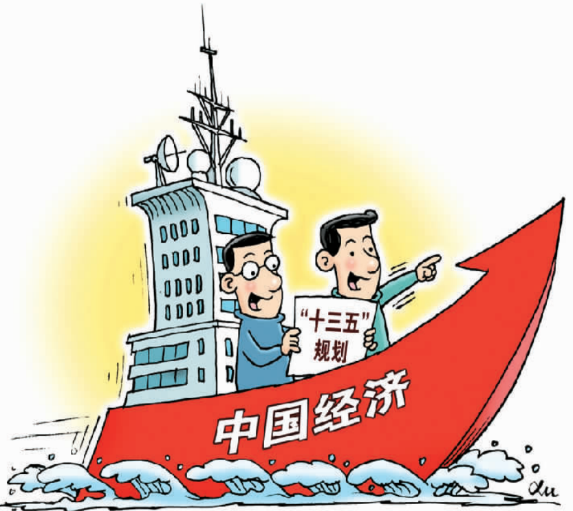
新航程 徐 骏作

管理体系能行吗？说了可以不做、做了无人监督还能行吗？换言之，这些变化对我们这样的执政党提出了什么