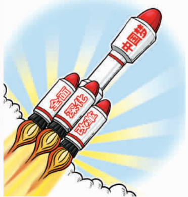
“腾飞动力” 程 硕作

不妨回顾一下，过去3年来，那些具有鲜明时代内涵的概念。从确立“两个一百年”奋斗目标到提出“中国梦”，从统筹“五位一体”总体布局到协调推进“四个全面”战略布局，从把握中国经济发展新常态到牢固树立五大发展理念……事实上，中