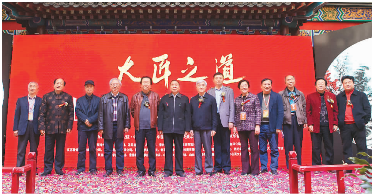
“大匠之道——大土三阳中国山水画精品展”3月18日在北京华夏珍宝博物馆隆重举行，中国国家画院院长杨晓阳、中国艺术研究院中国画院院长田黎明，以及美术界孙克、尚辉、刘龙庭、刘万鸣等出席了开幕仪式。