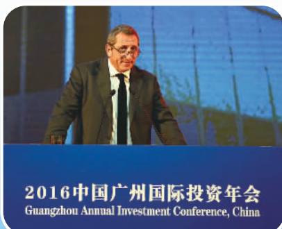
法国智奥会展有限公司全球首席执行官奥利维·费兰多就投资广州发言

条的下游向中上游发展。 电子商务、金融、信息服务、科技服务等现代服务业增速好于传统服务业，2015年，广州跨境电商企业总数已达879家，跨境电商进出口总额为68.5亿元，规模继续位居全国第一，金融、信息服务两大现代服务业占服务业比重比2014年末提高0.7个百分点。 在已取得的优异成绩基础之上，广州还将进一步释放潜力，推动经济大力发展。“十三五”时期，广州将实施一系列重大战略部署，包括建设“三中心一体系”、三大战略枢纽、一江两岸三带、多点支撑格局等。力争到2020年，广州市全地区生产总值达到2.8万亿元，年均增长7.5%以上，人均生产总值达到18万元左右，力争提前实现全市生产总值和城乡居民人均收入比2010年翻一番。