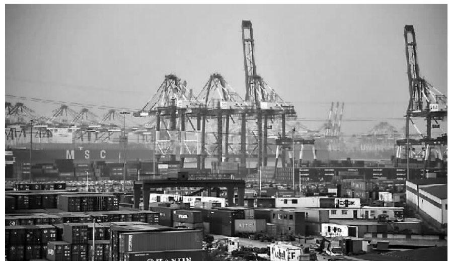
青岛港2015年实现货物吞吐量4.3亿吨。图为忙碌的青岛港。

近年来，青岛加强健康青岛建设，发展健康养老服务业，推进疗养康复、养生保健、养老服务、健康管理等产业发展，全力支持打造健康医疗精品项目，加快高端医疗项目的落地实施，先后引进了多家国内知名的医疗机构来青办医。与此同时，青岛还将建设国内领先、国际一流的健康产业基地，加快崂山湾国际生态健康城建设，打造具有较强国际影响力和区域特色的“国际健康城”，加快提升健康养老服务能力。