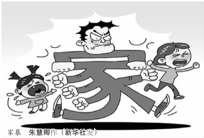
家暴 朱慧卿作

两次华裔虐童案件一经报道，华人社区哗然一片，纷纷通过媒体谴责这两个女子，认为她们心如蛇蝎，虎毒不食子，怎忍心连自己亲生女儿都不放过。然而事实