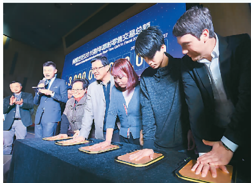
3月21日，在浙江杭州，5名来自全球的“剁手党”（买家代表）现场制作手模。当日14时58分，阿里巴巴集团2016财年零售交易额突破3万亿元人民币。