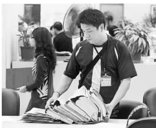
台北市府全力发展“行动签核”,厚重的纸质公文由此将被电子公文取代。(资料图片)

办公不用纸张是怎样一种体验?台北市府近年践行“无纸化”,在公文及会议等方面率先革新,让市府办公人员使用电子终端阅读各项材料并批阅公文,以求节省纸张及提升效率。在公文电子化方面,去年台北市府“在线签核”的公文达173万件,节省纸张累积高度超过台北101大楼。 为了加快行政流程,台北市府除可让主管以社交软件截图附上公文下达指令,更大规模翻修公文系统,全力发