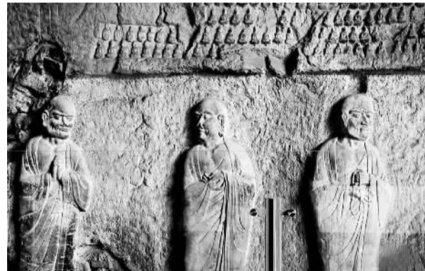
中国佛教石窟艺术宝库龙门石窟“特窟”看经寺日前开门迎宾，首批游客进入洞窟，近距离观赏中国石窟中现存最精美的一组唐代石刻罗汉群雕和最完整的佛法传承29祖圣僧像。图为看经寺内的唐代石刻罗汉群像。

河北省廊坊市广阳区京东大鼓传习所最近成立，这是河北省内第一家以传承、发扬京东大鼓艺术为宗旨的团体，为热爱京东大鼓的人们提供了一个学习、交流的平台。京东大鼓，是全国著名的曲艺曲种之一。2006年，经国务院批准列入第一批国家级非物质文化遗产名录。图为曲艺爱好者在传习所表演京东大鼓。