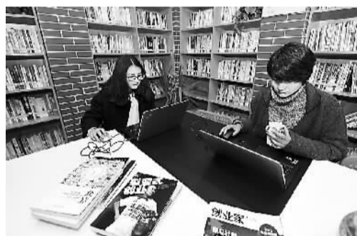
创客们在浙江省义乌市市的众创空间书吧阅读、上网与交流。

文艺是给人以价值引导、精神引领、审美启迪的；文艺最能代表一个时代的风貌，最能引领一个时代的风气。而今，时代呼唤重拾“工匠精神”！作为“灵魂的工程师”，文艺工作者责任重大，责无旁贷。正如工信部工业文化发展中心主任罗民所说：“一个拥有工匠精神、推崇工匠精神的国家和民族，必然会少一些浮躁，多一些纯粹；少一些投机取巧，多一些脚踏实地；少一些急功近利，多一些专注持久；少一些粗制滥造，多一些优品精品。”希望我们的文艺工作者“铁肩担道义，妙手著文章”，领风气之先，塑“工匠精神”，讲好中国故事、传播好中国声音、阐发好中国精神、凝聚起中国力量，创作出更多为人民喜闻乐见的文艺精品。