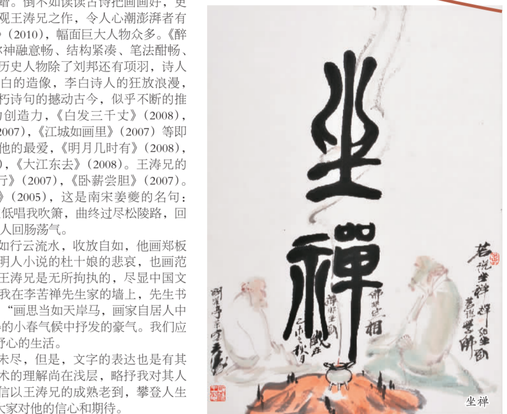
王涛，1943年生，安徽合肥人。原名王守信，号寄醉园主，字闲淡亭客。1967年毕业于安徽师范大学艺术系美术专业班。1981年毕业于中国美术学院国画系研究生班。1985年后出任安徽省书画院院长，安徽省美术家协会副主席、中国美术家协会理事、中国美协中国画艺委会委员、中央文史研究馆书画院艺委会委员，安徽省文史馆馆员。

现任中国书画学会副会长，安徽省书画院名誉院长，国家一级美术师，享受国务院授予有特殊贡献的政府津贴。