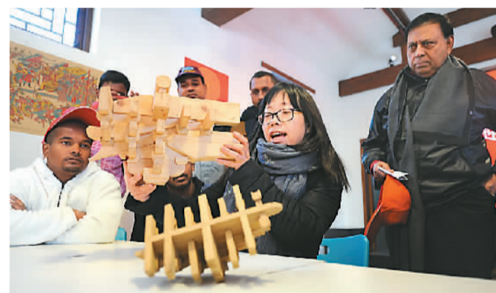
3月11日,应全国青联邀请,斯里兰卡青年代表团一行30人来到北京市东城区史家胡同博物馆参观,参与榫卯结构体验活动,感受中国古建筑文化的精髓。