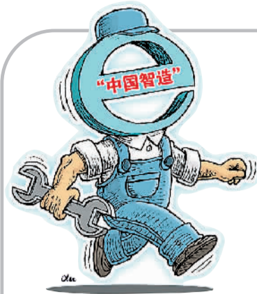
徐 骏作

2015年,中国科技进步贡献率达55.1%,国家创新能力世界排名提升至第18位,装备制造业规模超过全球总量的1/3。然而,圆珠笔、电饭煲这样的“小物件”,却暴露出我国制造业结构性短板。