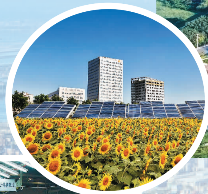
中央大道光伏发电