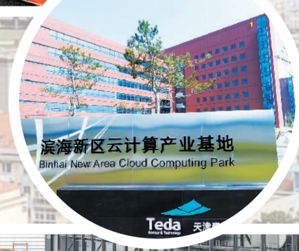
滨海新区云计算产业基地 Binhai New Area Cloud Computing Park