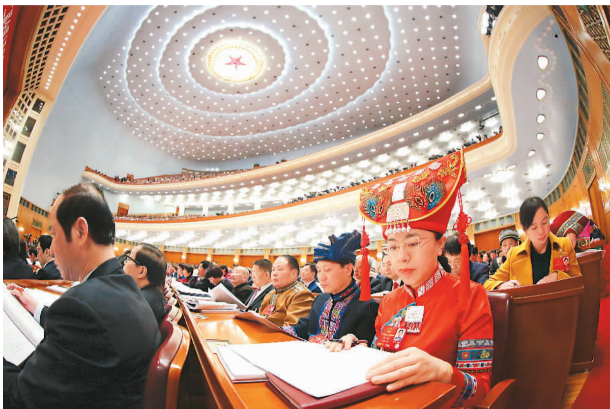
3月5日，第十二届全国人民代表大会第四次会议在北京人民大会堂开幕。图为代表们在认真听取政府工作报告。