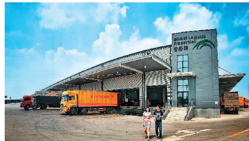
普洛斯国际航空物流枢纽港基地

西咸新区空港新城积极开展临空经济示范区、国家示范物流园区、全国优秀物流园区申报工作,目前已从全国1210家物流园区中脱颖而出,被中国物流与采购联合会物流园区专业委员会授予“2015年度全国优秀物流园区”称号;被省文化厅授予“陕西省文化产业示范基地”称号,首次跻身重点产业发展的“国家队”和“省级队”。