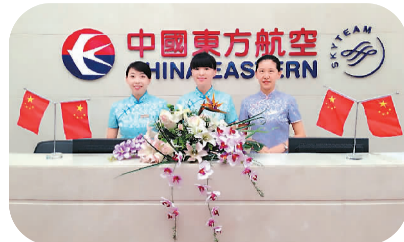
东航西北分公司要客分部接待人员笑靥如花

喜好、餐饮喜好、到达机场时间、办理手续的过程、航班延误时的续签处理、候机等待时间、登机落座直至旅客安全到达,所有的一切都不需要操心,全程都有人关注和服务。