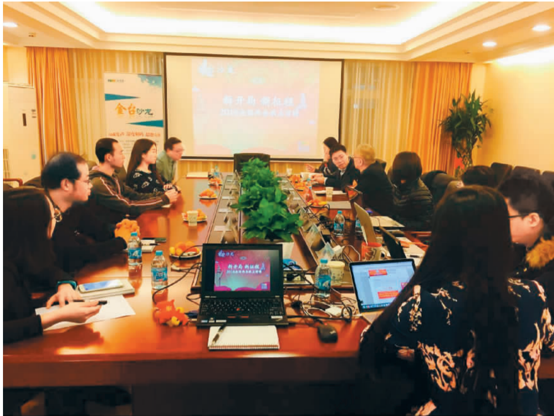
海外网金台沙龙现场

决定中国经济发展大计的全国两会即将在北京拉开帷幕。今年是“十三五”时期的开局之年,也是全面建成小康社会决胜阶段的开局之年。五年看头年,开局最关键。两会召开前夕,一系列与国计民生有关的议题未启先热,备受海内外舆论的关注。