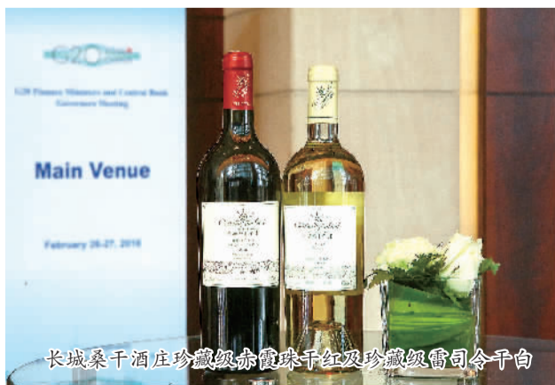
长城桑干酒庄珍藏级赤霞珠干红及珍藏级雷司令干白