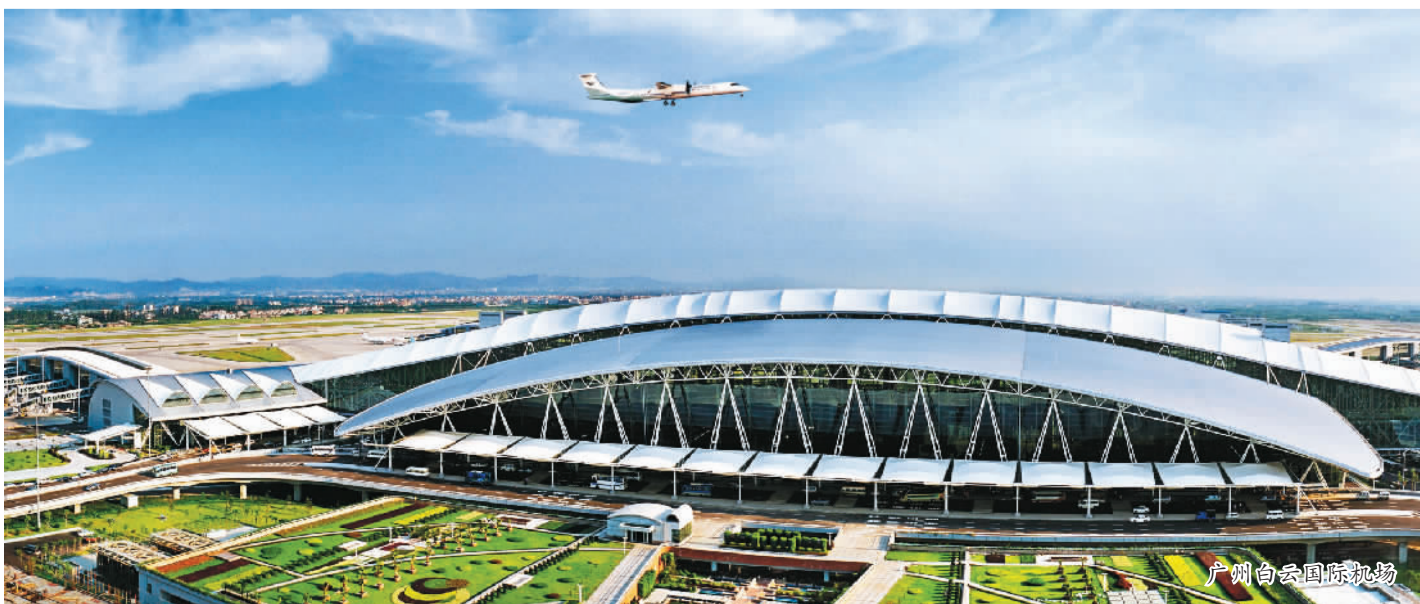
广州白云国际机场

广州市正站在更高的角度考虑自贸区发展问题，自贸区的发展将与周边地区的发展联动，服务珠三角产业转型升级，成为泛珠三角地区、21世纪海上丝绸之路的合作服务平台。