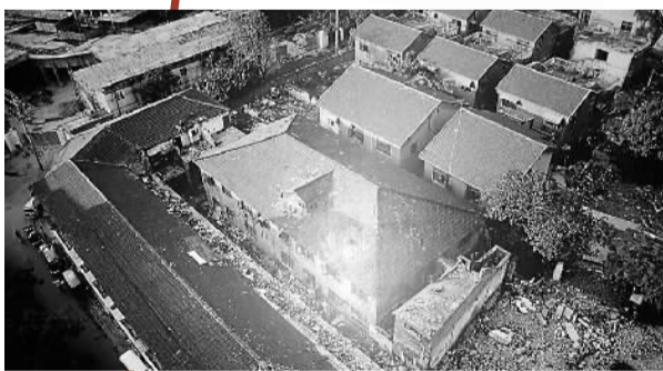
图为陈列馆展览的南京利济巷日军慰安所旧址照片

数据还显示,2015年在澳国际留学生总数比2014年增加了10%,达498155人。国际教育行业去年为澳大利亚经济贡献了200亿澳元(约合946亿元人民币),成为澳增长最快的五大行业之一,也是该国最主要的服务出口贸易之一。