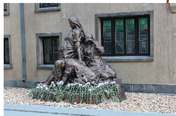
图为陈列馆入口处雕塑陈设

“战时日本当局制定‘慰安妇’制度,长期地、公开地、有计划地强征大批各国妇女,为日军官兵提供性服务、充当性奴隶,乃是人类数千年文明史上罕见的反人类暴行,充分暴露了日本军国主义的残忍、野蛮与暴虐。这是已被历史钉在耻辱柱上的铁的事实!”长期研究日军在南京实施“慰安妇”制度与“慰安所”遗址的南京大屠杀史研究会顾问经盛鸿教授说。