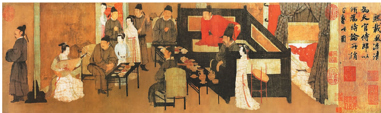
《韩熙载夜宴图》局部(宋摹本) 顾闳中(五代) 北京故宫博物院藏

此画曾被溥仪出紫禁城时带至长春，二战后流入民间。1945年，近代绘画大师张大千重金买下该画，后以极低价格转给中国大陆，使瑰宝免于流落海外。如今，《韩熙载夜宴图》完整保存在北京故宫博物院，有着重要的学术和欣赏价值。