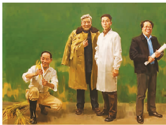
时代领跑者(局部) 中国美术学院创作组集体创作

此次重新开放的“领袖·人民——馆藏现代经典美术作品展”共展出国画7幅、油画20幅、雕塑15件，一件件作品，表现了领袖与人民的血肉关系以及在实现中华民族伟大复兴中国梦的过程中领袖与人民的风采。