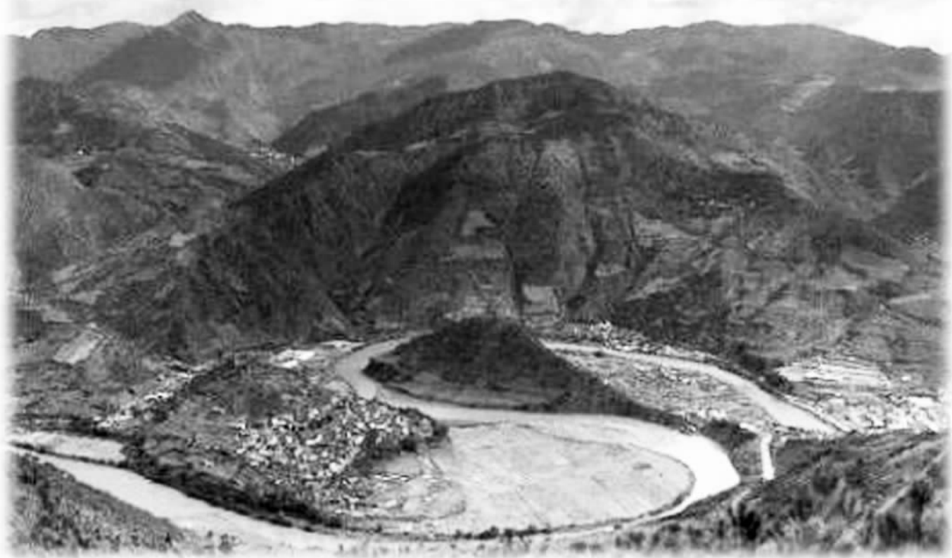
鹤壁淇河天然太极图