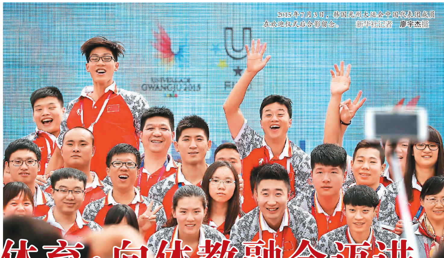
2015年7月3日, 韩国光州大运会中国代表团成员在欢迎仪式后合影留念。