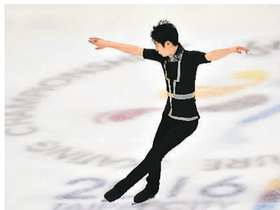
2月21日, 在台北举行的四大洲花样滑冰锦标赛男子单人滑比赛中, 中国选手金博洋(上图)以总分289.83分获得亚军。