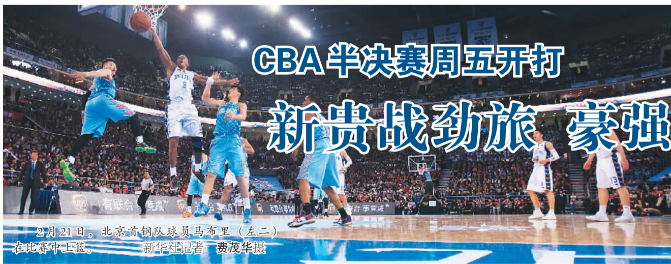
2月21日, 北京首钢队球员马布里(左二)在比赛中上篮。新华社记者 费茂华摄