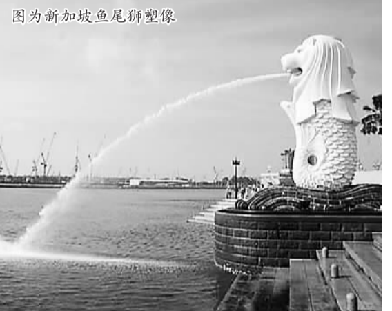
图为新加坡鱼尾狮塑像。