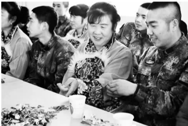
图为巴里坤哈萨克自治县花园乡“爱心妈妈”慰问老舍庙边防连官兵。(哈密政府网)

置等涉军保障政策情况与“双拥”创建挂钩评价机制，借助“双拥”创建平台，加大拥军优属、排忧解难力度，完善军民警民联防联治工作机制。”这是在新疆维吾尔自治区民政局长会议上对2016年“双拥”工作提出的具体要求。