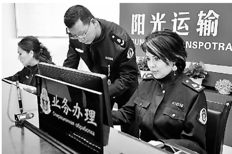
图为乌鲁木齐西域国际物流园区，国际道路运输管理部门工作人员正在为客商办理货物出境手续。

新疆维吾尔自治区位于丝绸之路经济带核心区，也是中国向西开放的窗口。随着国家“一带一路”战略的深入实施，新疆该如何在“一带一路”的机遇下发挥既有的区位优势、资源、经济与文化、品牌优势，实现跨越式发展？