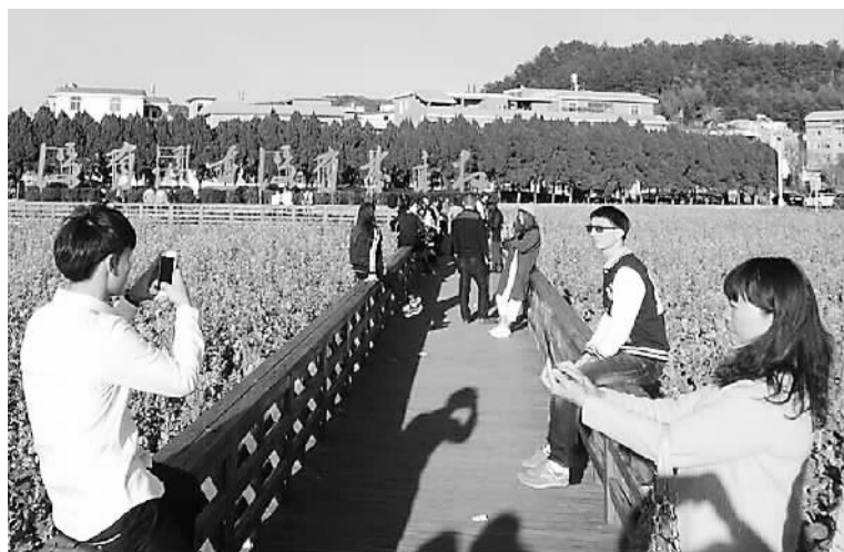
图为游客在上杭毛泽东才溪乡调查旧址前留影。

据悉，福建省级财政将安排专项资金对植树造林进行补助，补助款将根据植树造林的不同区域，从500元至100万元不等。