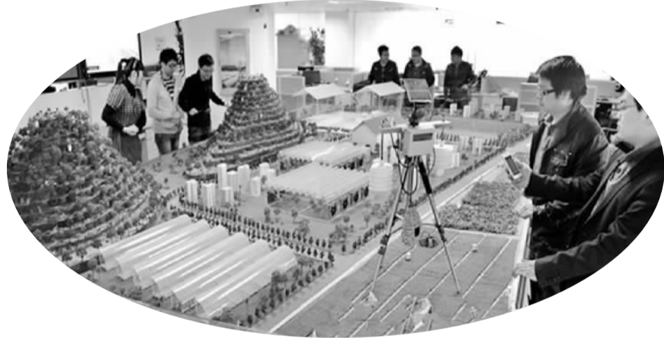
图为观众在参观福州新区规划模型

同时，福州新区要下好简政放权“先手棋”，深化行政审批制度改革，实施“非禁即入”的负面清单模式，完善国际化、市场化、法治化的营商环境。在扩大开放合作上探索创新，利用新区“四区叠加”（即国家级新区、福建自贸区福州片区、