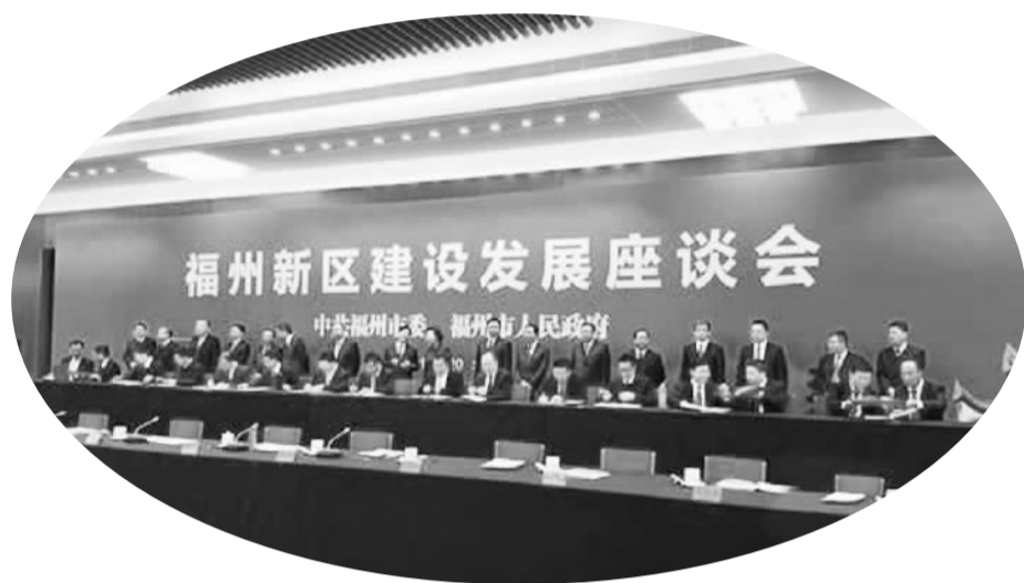
福州新区建设发展座谈会

福州市当地官员告诉记者，在“十三五”规划开局之年，福州的“新区建设年”也提上议事日程，福州新区注定会成