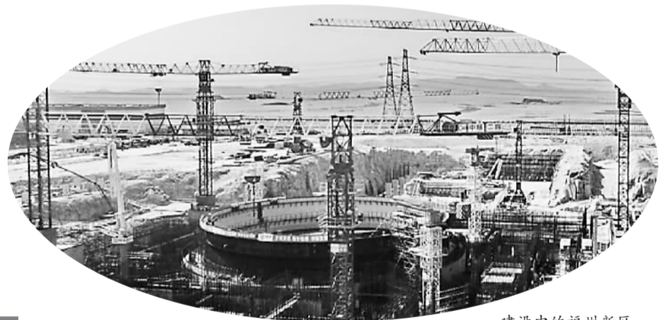
建设中的福州新区