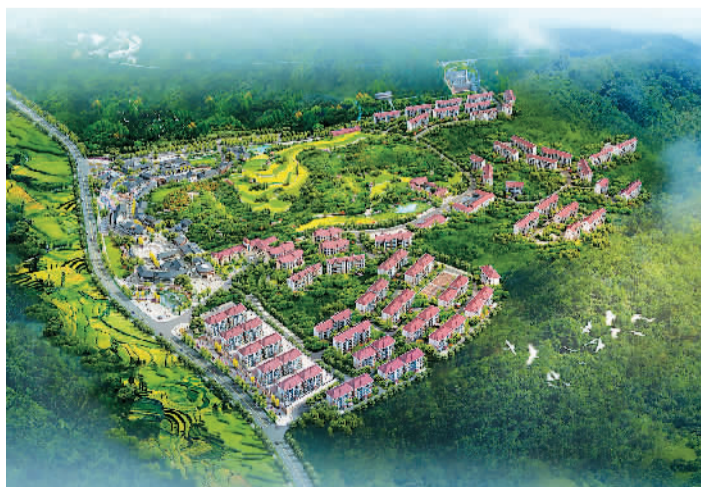
图为麻郎新型社区效果图

春节期间,记者走访了贵州省贵安新区高峰镇。去年6月17日,习近平总书记在贵安新区视察时强调:“新区的规划和建设,一定要高端化、绿色化、集约化,不能降格以求。”这为2014年初批复设立的贵安新区建设指明了方向和路径,提出了要求和期望。