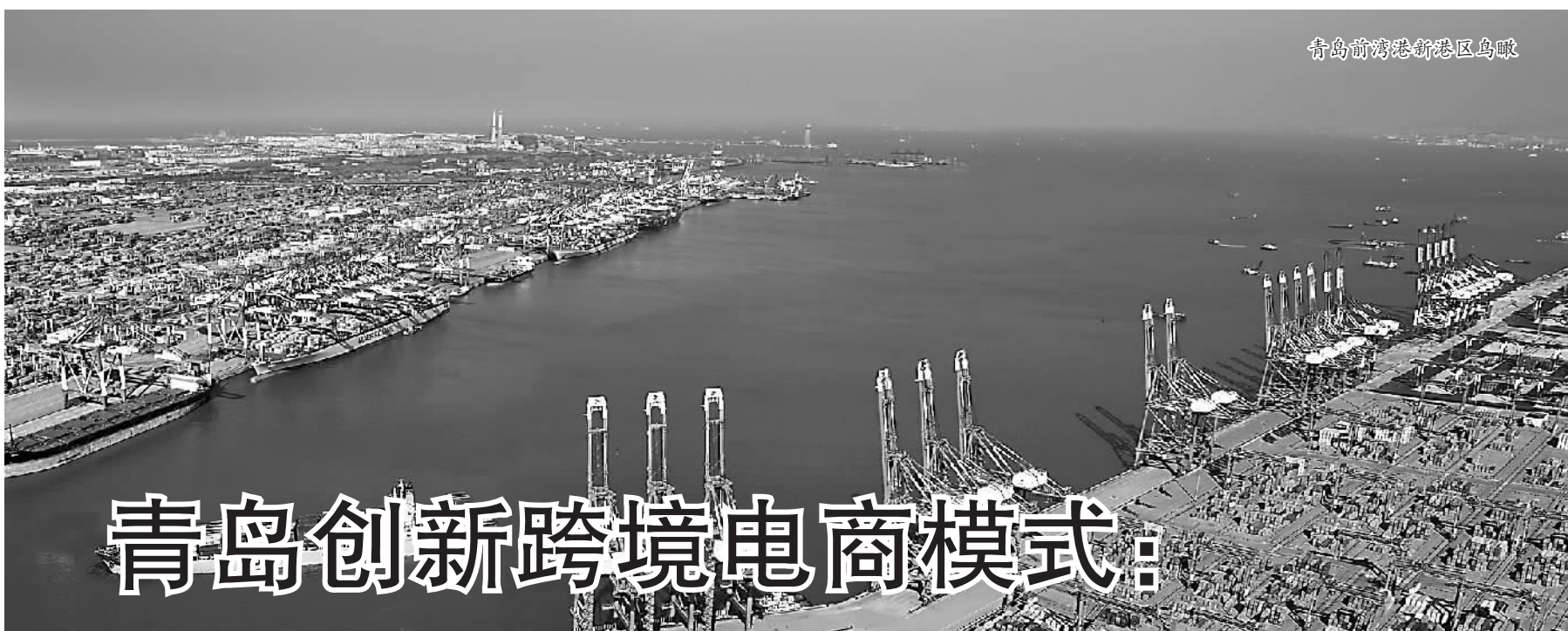
青岛前海港新港区鸟瞰