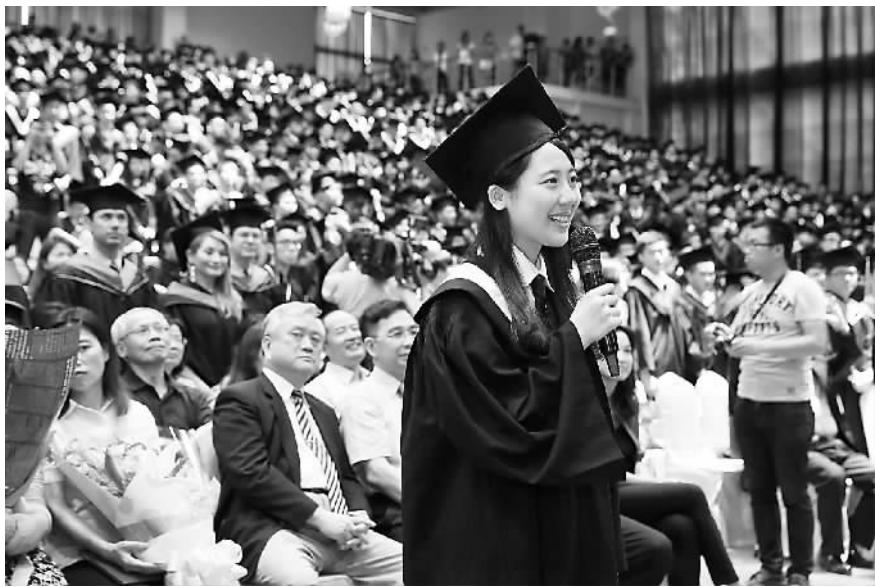
典礼上发言。图为在台湾淡江大学就读的一位陆生在毕业典礼上发言。

“兄弟登山，各自努力。”勤跑大陆的高中大学和大学，办讲座，打知名度，成为台湾高校一景。之前，台湾静宜大学为了揽生源，对陆生端出“优惠套餐”——全班成绩前5名者可获2.5万元（新台币，下同）至5万元奖学金，4年期间至少寒暑假出国游学或当交换生1次等。铭传大学也频频赴大陆“抛绣球”——