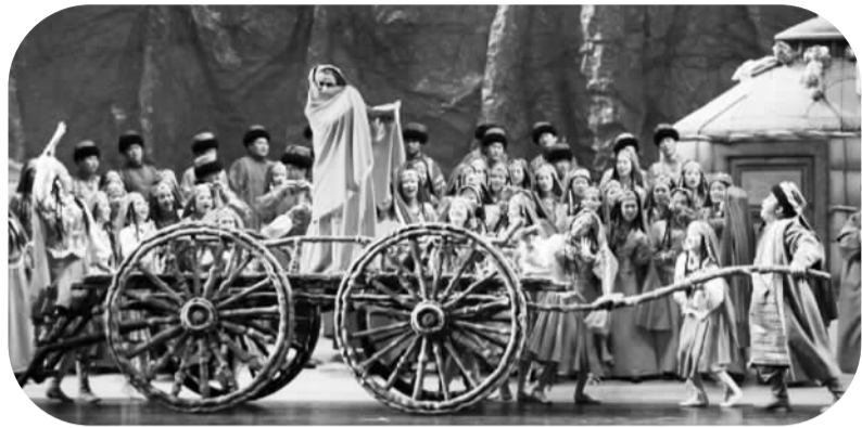
国家大剧院将于春节期间上演原创作品《冰山上的来客》 据国家大剧院官网