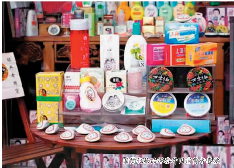
国货化妆品深受外国消费者喜爱

就是从游客的实际需求出发，针对消费者的消费习惯、购买能力和携带要求等细节做出改变。无论是研发设计环节，还是制作环节都应当注重品质。狭义的旅游商品，应当凸显民族特色、地方文化，能够代表一地风情和文化底蕴；广义的旅游商品，则可以创新营销途径，让更多本土百姓信赖的特色名优产品进入购买者的视野。