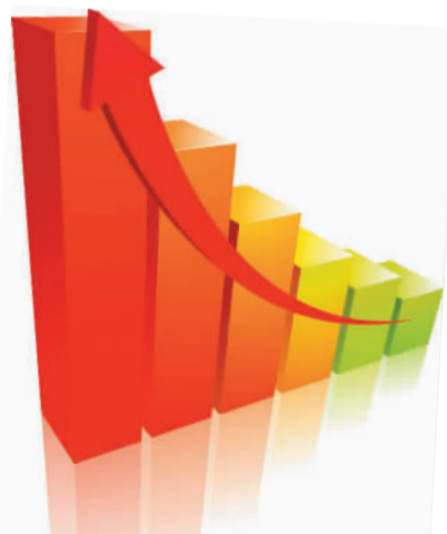
本报电(刘荷英)据赣州海关统计,2015年赣州市进出口总值为258.3亿元,比上年同期增长7.8%。其中进口47.4亿元,增长