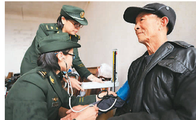
1月28日,武警江西总队扶贫小组到定点扶贫县走访慰问,实地考察了解总队精准扶贫援建项目,看望困难企业、孤寡老人和困难群众,送去新春问候。