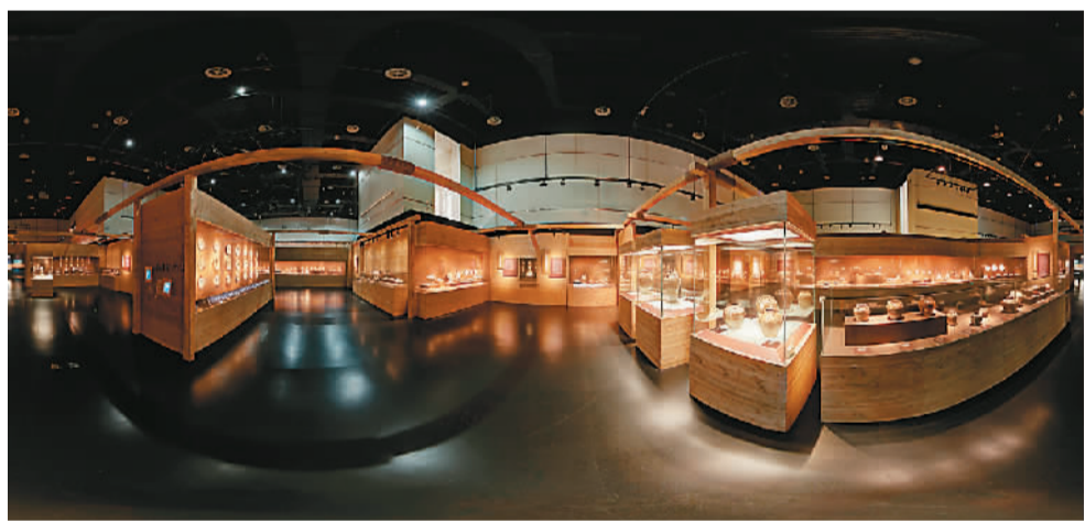
“牵星过洋展”虚拟漫游网上展示

在“牵星过洋展”的图录中，应用增强现实技术和三维技术，观众手机下载APP并将摄像头对准图录，即可呈现展品的3D动态互动画面，可720度旋转展品，观察每一个细节。这是该馆运用增强现实技术在图录的第一次尝试，充分拓展了图录的可读性，深受读者喜爱。在“千年风雅展”中，将展览中的10件精品制作成动态图，让静态的画作灵动起来，赋予画作生命力，让展览更加贴近观众。