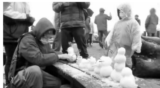
台湾民众喜迎降雪。(资料图片)

相形之下,岛内麻辣火锅与姜母鸭店内却人潮汹涌。火锅业者称,业绩比平常增加二到三成左右,算是今年入冬后生意最好的一波。饭店只要推出药膳排骨、韩式泡菜锅等冬季暖锅,同样顾客盈门。全台的温泉生意也是财源滚滚。