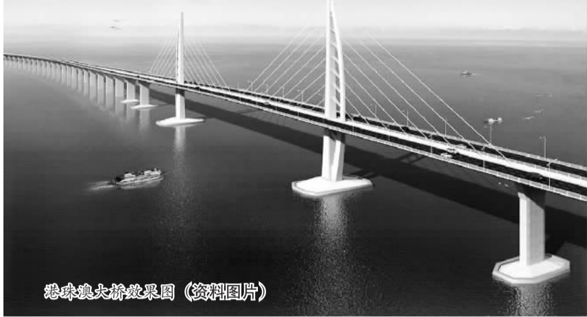
港珠澳大桥效果图(资料图片)

联通广东珠海市和港澳、日前被英国媒体评为“现代世界七大奇迹”之一的港珠澳大桥，内地段已接近完工，而工期一再延误的香港段，至今还深陷香港立法会的“拉布(指反对派拖延议事)”泥潭之中。追加拨款迟迟不能到位，能否在2017年底完工也成了未知数。