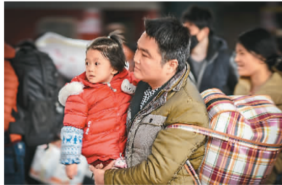
1月24日，在广州火车站站台，一名怀抱孩子的乘客匆忙赶路。