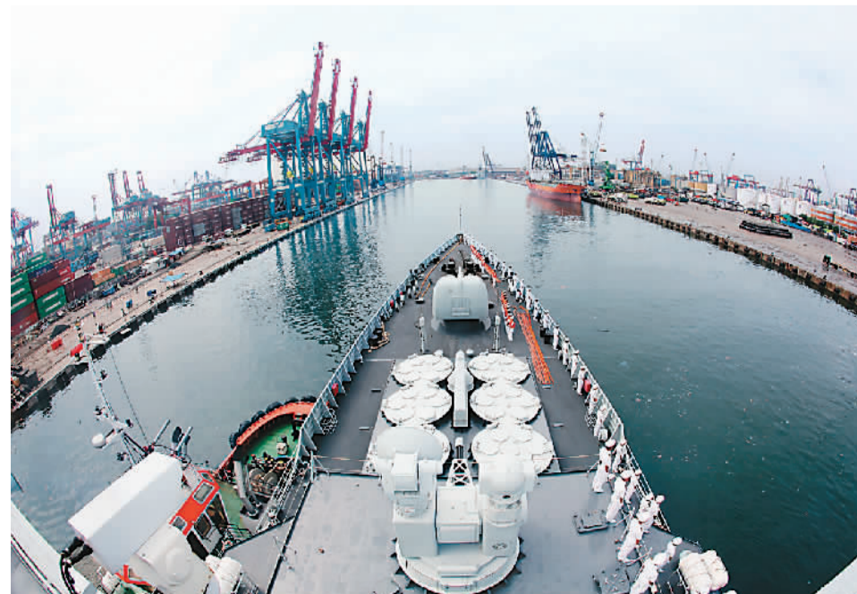
当地时间24日上午，中国海军152舰艇编队抵达雅加达港，开始对全球访问的最后一站印度尼西亚共和国进行为期5天的友好访问。 图为中国海军济南舰驶入印度尼西亚雅加达港口。