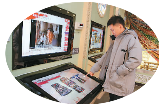
观众正通过电子屏了解展厅内容

在《西域历史的记忆——新疆历史文物陈列》展厅，图表、照片、景观模型、摹绘、历史文献、幻影成像、多媒体演示等吸引了不少参观者，互动游戏更是增强了观众的参与度，拉近文物与观众的距离。