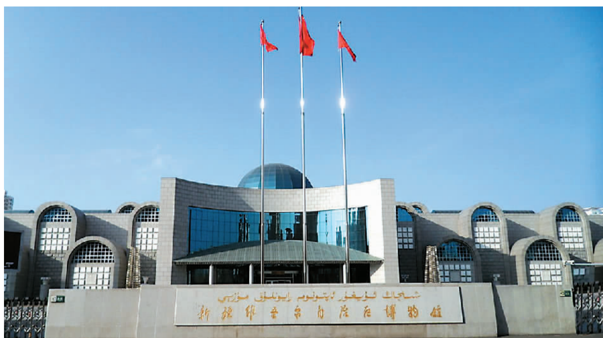
新疆维吾尔自治区博物馆外观