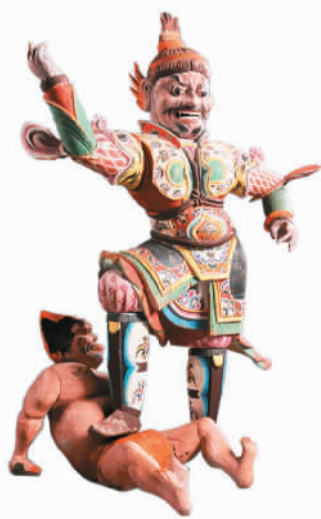
彩绘天王踏鬼木俑

唐代，高86厘米，1973年吐鲁番阿斯塔那墓地206号墓出土，木质，从躯体至牙齿是由三十六块大小不等木块雕刻后粘合而成。天王全身施彩，头部为火苗状，浓眉倒立，身穿铠甲上有龙头装饰，并用红、黄、蓝、绿、黑等色绘出流云、缠枝花卉、宝相花纹，色彩绚丽，富丽堂皇。天王俑是作为墓葬守护神置于墓室门外，保卫墓主人“安宁”之物。这类木雕天王踏鬼俑，到目前为止国内仅此一例。