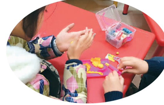
周末社教活动，小朋友在家长的帮助下用橡皮泥捏出自己喜欢的文物。

左右墙面选择当地代表性器物纹饰——狮形金牌饰，忠实再现历史，表现出特有的地域文化。一单元以一组新石器时代古人类遗址为主题，采用微缩沙盘手法全景展示分布于新疆当地多处古人类遗址。小河遗址景观复原，以观者的视角，大景深表现遗址的壮美与苍凉。努拉山铜矿遗址，用一组大型展柜展示铜矿剖面模型，并微缩复原炼铜铸铜场景。在一侧设计一组大型全息影像，动态展示海墓地女子复原像及墓地结构。高昌故城遗址通过一组大型沙盘展示，沙盘两侧运用风蚀地貌造型突出地域特征，并在前方设置多媒体互动及文字说明。