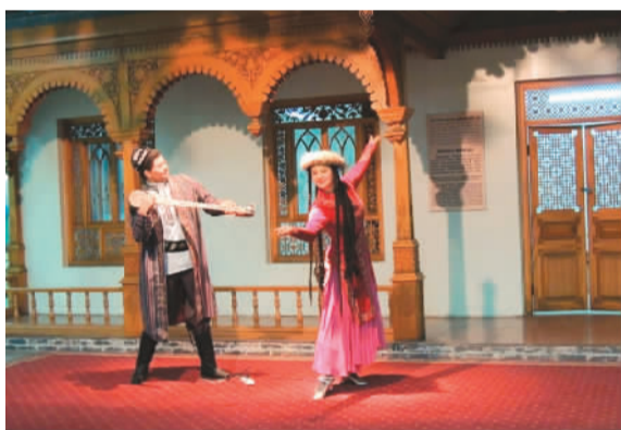
新疆民族风情陈列

馆内常年免费对外开放四个基本陈列，构成一幅新疆历史文化的壮观画卷。《西域历史的记忆——新疆历史文物陈列》《新疆民族风情陈列》《逝者越千年——新疆古代干尸陈列》和《新疆古代服饰的记忆展》，涵盖了新疆珍贵的文物考古实物和资料，让来参观的游客通过这幅画卷触摸到新疆历