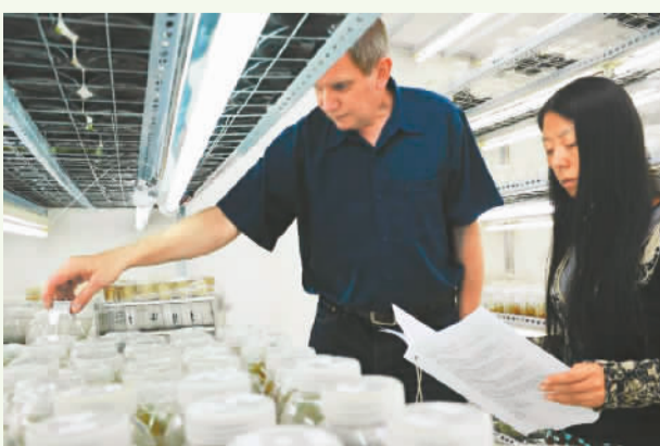
豪格尔帕奈“克隆”的优质的植物品种。