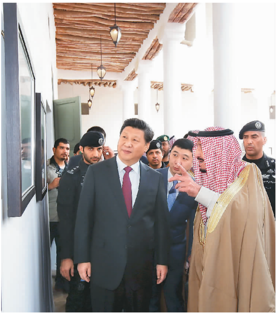
1月20日,习近平在萨勒曼陪同下参观“四方宫”。

本报利雅得1月20日电(记者杜尚泽、黄培昭)20日,国家主席习近平在沙特阿拉伯国王萨勒曼陪同下参观“四方宫”。