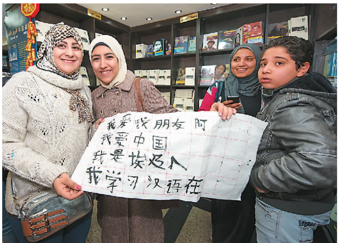
1月19日，中国主题图书展销周在埃及首都开罗开幕。图为几名埃及学生在活动现场展示自己书写的汉字。