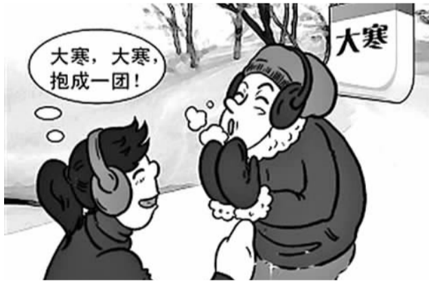
大寒，大寒，抱成一团！

时至今日，尾牙祭已慢慢退出了大寒习俗，但中国福建沿海、台湾等一些地方仍保留着尾牙祭的传统。