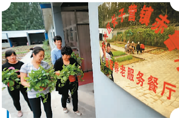
居家式养老走进北京乡村，图为大兴区亦鲁村工作人员为养老服务中心布置绿植。

“今年还将新建至少40个街乡镇养老照料中心。”李万钧表示，已经建成的100家养老照料中心和养老机构将完善辐射居家养老服务功能，为区域内老年人提供短期照料、助餐、助洁、助医等10项居家养老服务。同时，今年还将支持朝阳区试点建设80个、海淀区试点建设10个具有文化娱乐、日间照料、精神关怀、养老助餐服务等功能的居家养老服务驿站。