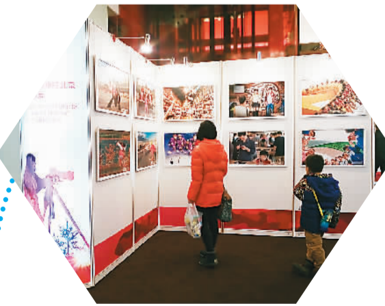
图为游客母子正在参观摄影展。