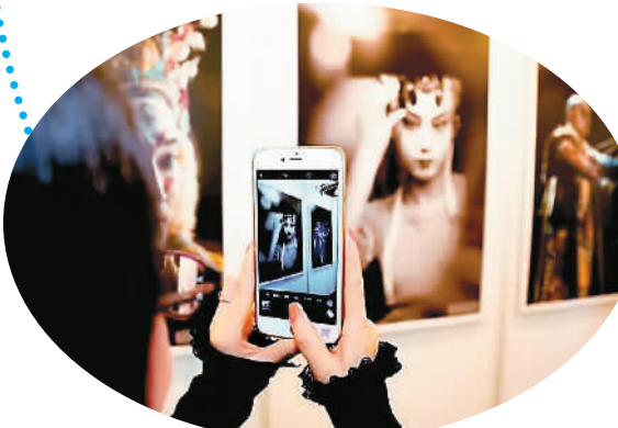
图为参展游客正在用手机拍照。

近日，以“魅力北京·激情冬奥”为主题的“2015年外国摄影师拍北京”摄影展在金宝汇购物中心开展。不少市民慕名而来，追随外国摄影师的镜头欣赏最美北京城。