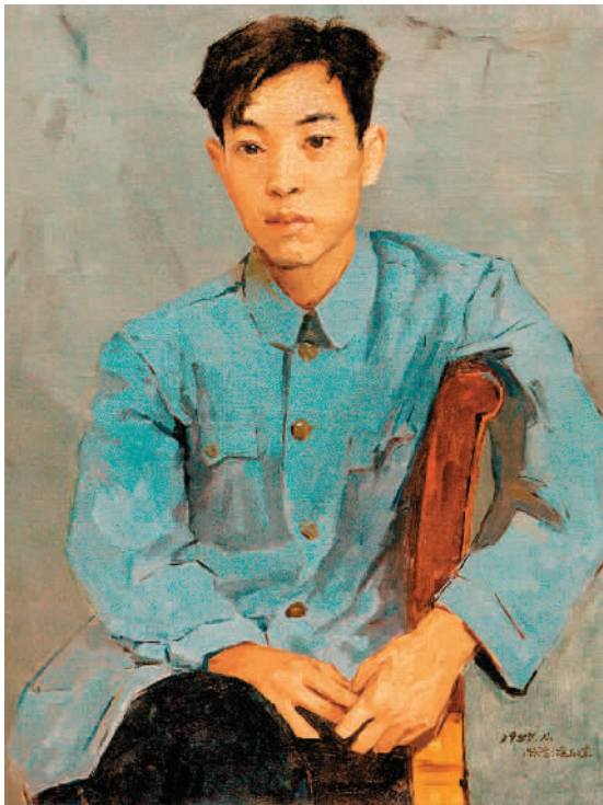
佟景韩像(临梅尔尼科夫) 靳尚谊

而临摹作为重要方法，可以着重解决色彩问题。但是如果仅仅临摹图片，就会有很大局限性。1978