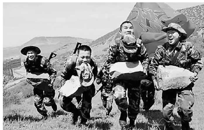
七支队特勤中队武警战士在进行野外特训。