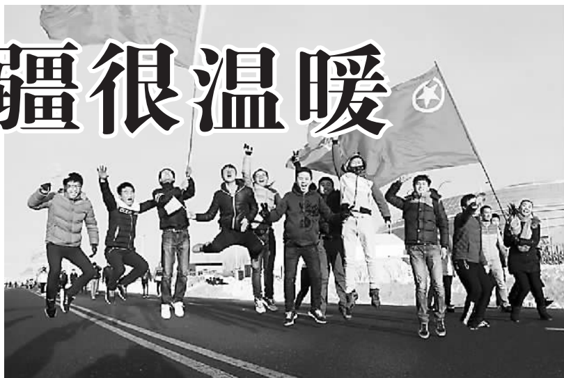
乌鲁木齐举办万人徒步签名活动，喜迎“十三冬”。图为到达终点时某高校的学生们兴奋地跳了起来。图片来源：天山网

第十三届全国冬季运动会进入了倒计时，新疆维吾尔自治区各族人民以不同的活动方式表达着对“十三冬”的期盼。随着自治区72个大型活动项目在各地州市县的陆续开展，天山南北到处洋溢着浓郁的喜迎“十三冬”的气氛。各地旅游局以此为契机，纷纷在冬运会前后推出各项优惠政策、惠民活动。冬季旅游的热潮，也为“十三冬”增添了一丝暖意。