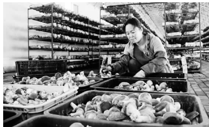
第九师166团瑞景合作社食用菌生产基地种植户采收、分拣香菇。

同时，九师在新品种种植和新技术应用上狠下功夫，促进了设施农业结构调整。依托“投资引导、鼓励买断、统一管理、打响品牌、形成规模、增加效益”为核心内容的设施农业建设和发展理念，着力打造“基地+合作社+出口公司”的设施农业产销发展模式。以华瑞、永利、冠凌、绿源等企业为龙头，建立起多条设施农产品销售渠道。这实现了果蔬产品分级、包装、加工、仓储、运输、销售一条龙。九师生产出的果蔬不仅丰富了自己及周边城乡居民的“菜篮子”，而且远销到哈萨克斯坦、俄罗斯等国。