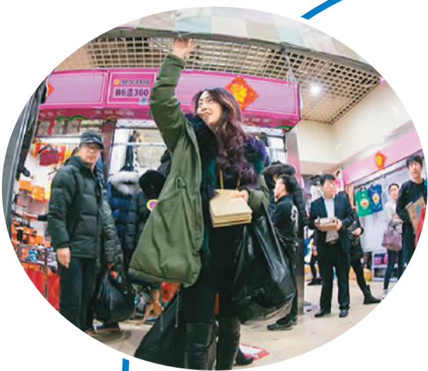
2015年12月31日，很多商户从“动批”商圈的聚龙服装市场撤离。