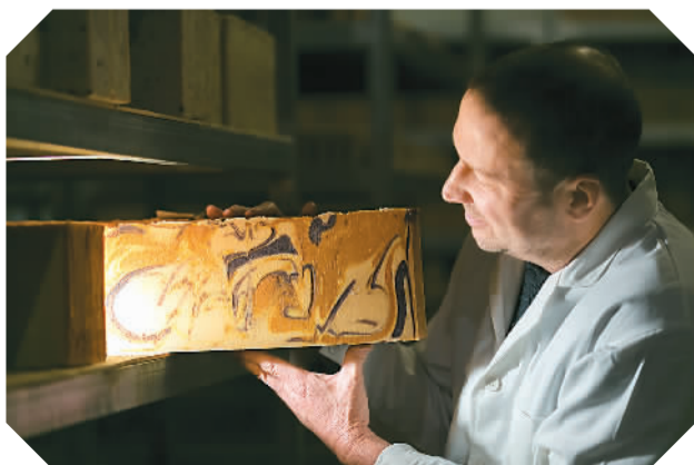
图为二山在制皂实验室

为污染的问题，很多中国人在离开中国，他们问我为什么不回加拿大。我说加拿大也有污染的问题，五大湖的水质也不好，这个是全世界的，无论在哪里都是一样的。”二山风趣地说，“现在和许多人一起做环保，有劲！”