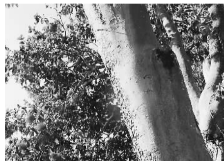
▲ 图为大理市区的茶花。

第十届中国(大理)茶花博览会、第九届大理国际茶花博览会将以大理古城文庙为茶花展主展区,分为国际茶花品种展区、中国茶花展区、大理茶花展区等,展示展销包括“恨天高”、“朱砂紫袍”、“松子鳞”等涵盖大理茶花“八大名花”为代表的海内外茶花精品和文化创意。