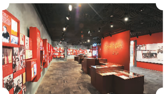
中国现当代文学展

中国现代文学馆自1985年建馆至今，已经走过30个春秋，如今是世界上规模最大的文学专业博物馆，面积4万平米，藏品80余万件，馆藏条件世界一流，它的中西结合、园林风格的建筑设计还获得中国建筑设计鲁班奖。