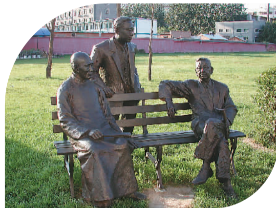
曹禺、叶圣陶、老舍塑像

“设计新颖、设备现代化的中国现代文学馆新馆，不仅是中国20世纪文学史当之无愧的缩影和藏宝阁，还将成为中国文学迈向新世纪，构筑更加光耀灿烂明天的奠基石。”吴义勤说。