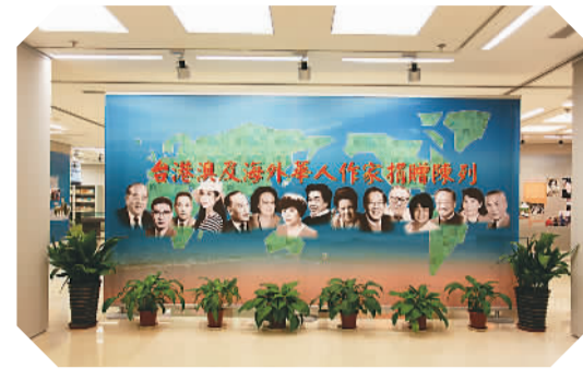
台港澳及海外华人作家捐赠展

这些展品的背后都有感人的故事，柏杨先生不顾陈水扁到他家里阻拦，把自己的全部文物文献捐赠给了文学馆；梁羽生去世前把自己用的棋盘、钢琴等文物文献都捐给文学馆。台湾作家林海音、痲弦等也把自己的文物文献捐赠给文学馆，痲弦将自己的书和藏品装了50多个集装箱从美国寄回来。台湾“70后”作家陈文发把自己的海外签名书8000多册、影像光盘100多个都捐给文学馆。