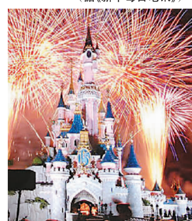
迪士尼童话城堡效果图。

上海迪士尼度假区有望于2016年春季开幕,具体开业时间将由中美双方协商确定后再行公布。(据《新华每日电讯》)