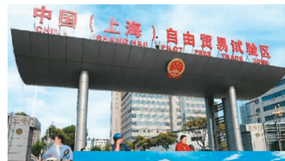
图为上海自由贸易试验区(资料图)

重庆和广东甚至设定了提前实现目标的具体年份,其中,重庆明确要求“到2017年全市地区生产总值和城乡居民人均收入比2010年翻一番”;广东提出,到2018年,全省小康指数达到97%以上,力争提前实现地区生产总值和城乡居民人均收入比2010年翻一番。