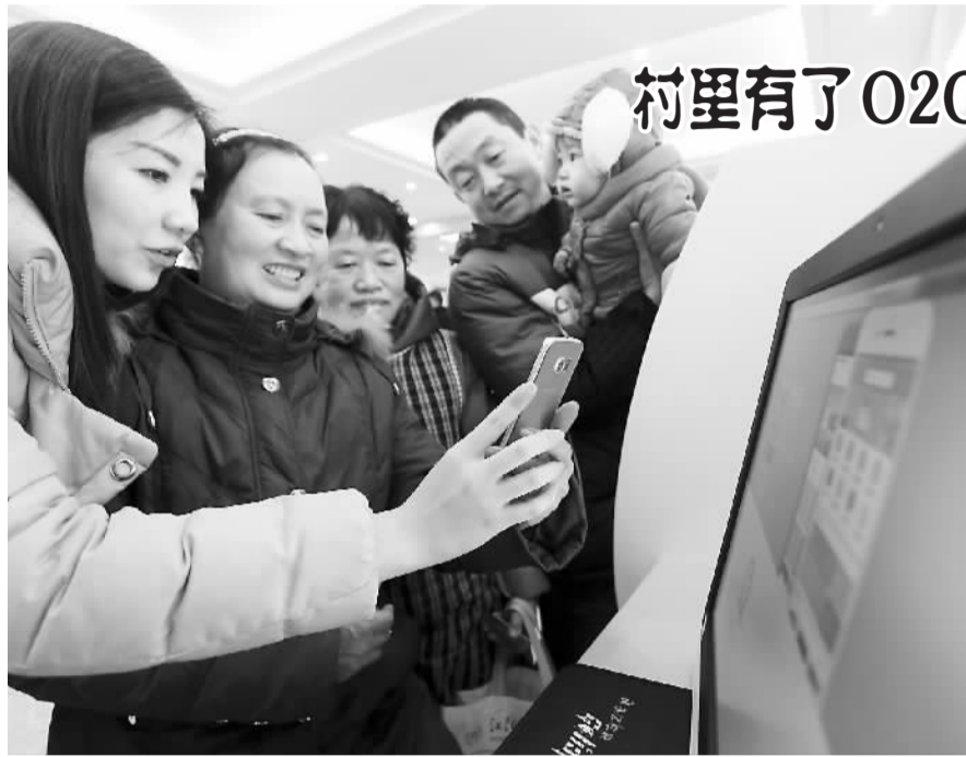
村里有了O2O电商平台

2016年央行还将推动金融市场规范创新发展。防范和化解经济金融风险，维护金融稳定。进一步提升人民币国际化水平。深度参与全球金融治理，继续推动金融业双向开放。深化外汇管理体制改革，完善外汇储备经营管理。加强金融基础设施建设，提高金融服务与管理水平。